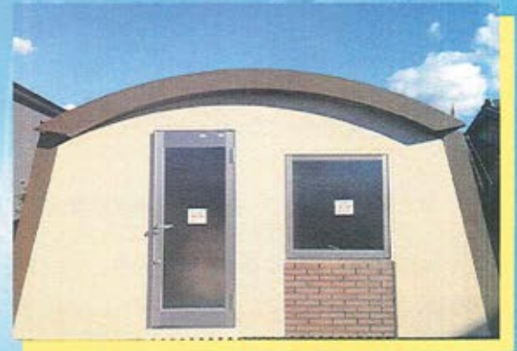
当社敷地内モデルハウス